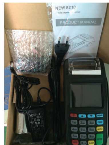
Рис. 2. Комплект поставки терминала New 8210