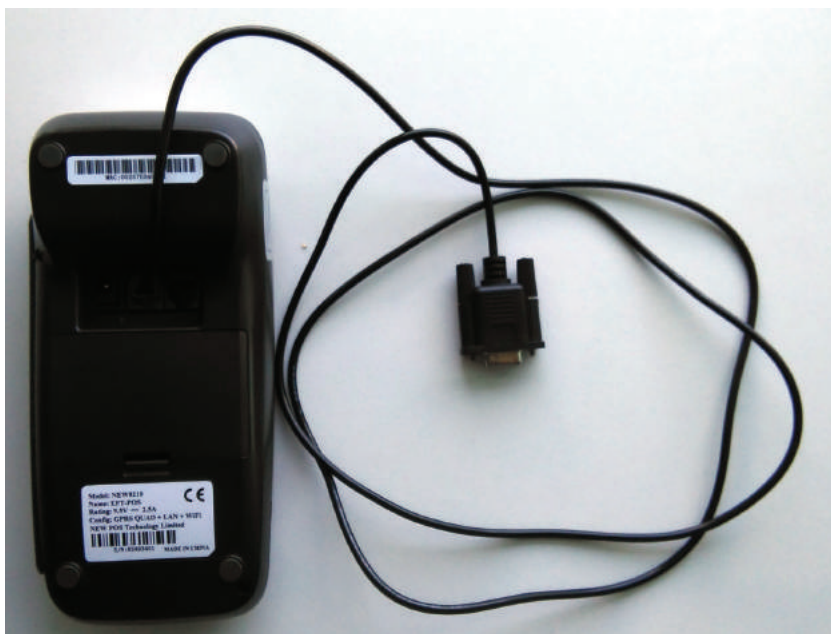
Рис. 11. Подключение кассовому аппарату

Для подключения терминала к кассовому аппарату воспользуйтесь специальным COM-кабелем (может не входить в комплект поставки). Для подключения вставьте кабель в порт RS232 терминала как показано на рис. 11 и присоедините к COM-порту кассового аппарата.