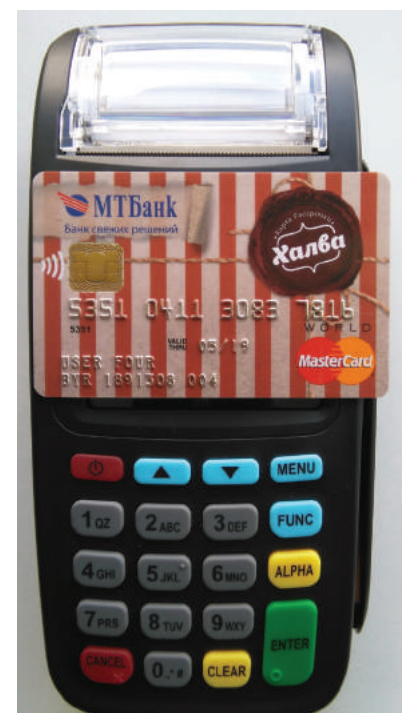
Рис. 6. Чтение бесконтактной смарт-карты

Для того чтобы считать информацию с бесконтактной смарт-карты, просто поднесите ее в область экрана терминала и задержите ее там до звукового сигнала (Рис. 6).