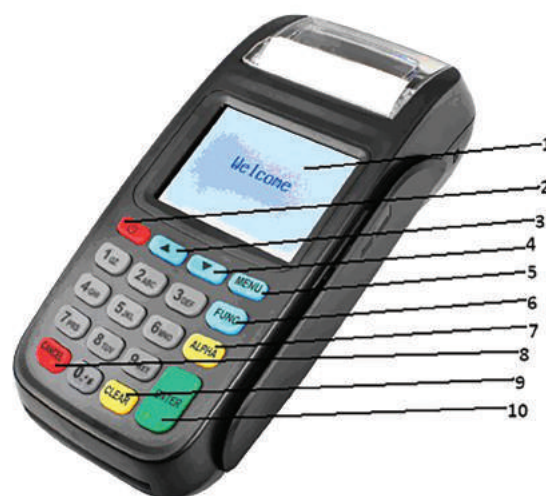
Рис. 3. Внешний вид терминала

Ввод символов осуществляется с алфавитно-цифровой клавиатуры терминала. Конкретные значения клавиш зависят от загруженного приложения.