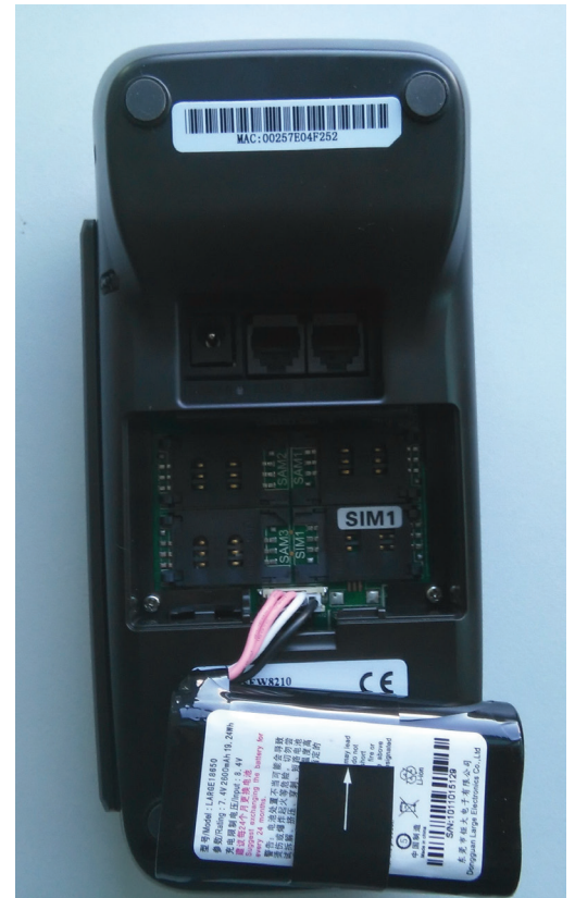
Рис. 12. Извлечение батареи

Поместите SIM-карту в слот, помеченный как «SIM1». Для этого откройте держатель карты, сдвинув его вправо, поместите SIM-карту и закройте слот, как показано на рис. 13.