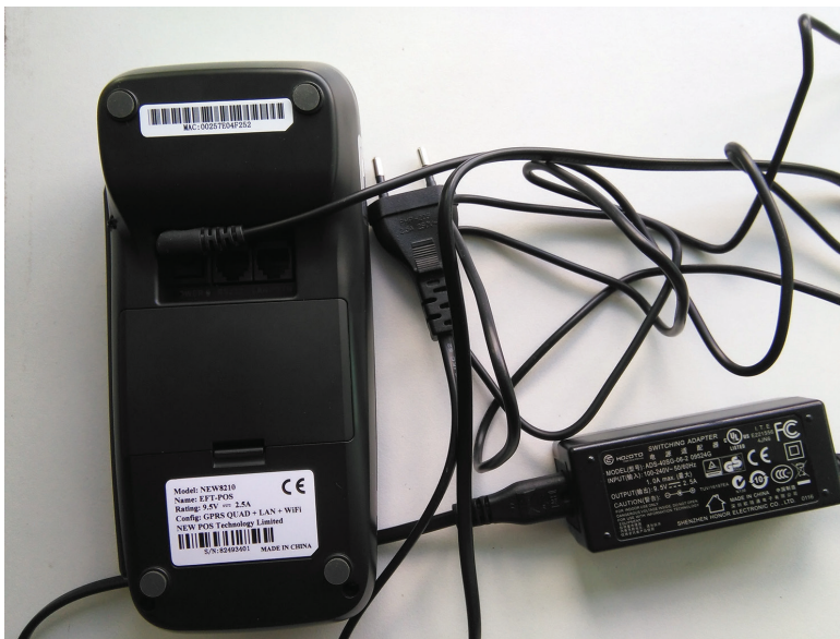
Рис. 8. Зарядка батареи

При необходимости зарядки батареи воспользуйтесь блоком питания, входящим в комплект поставки терминала. Вставьте кабель блока питания в терминал, как показано на рис. 8, и подключите блок питания к электросети.