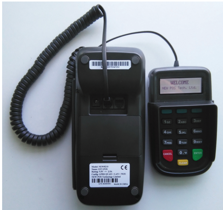
Рис. 10. Подключение ПИН-клавиатуры

Выносная ПИН-клавиатура используется для безопасного ввода ПИН-кода в тех случаях, когда нет возможности передать терминал клиенту. Для подключения ПИН-клавиатуры вставьте кабель в порт RS232 терминала, как показано на рис. 10. Клавиатура обнаружится терминалом автоматически.