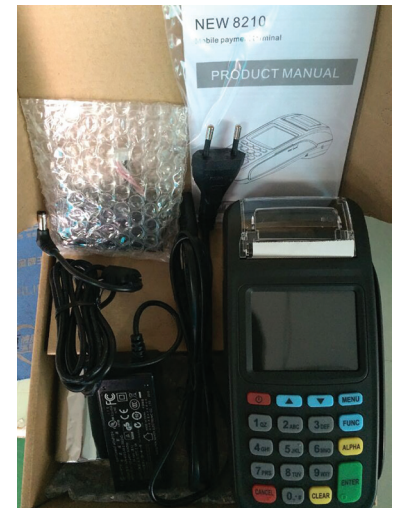
Рис. 2. Комплект поставки терминала New 8210