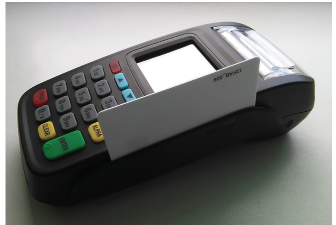
Рис. 4. Считывание карты с магнитной полосой

Для того чтобы считать информацию с магнитной карты, проведите ею в любом направлении через специально предназначенный ридер для карт с магнитной полосой. Магнитная лента должна располагаться в нижней части карты, повернутая магнитной полосой к экрану терминала. Важно не перемещать карту слишком медленно. (Рис.4)