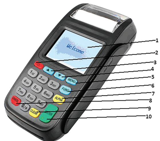
Рис. 3. Внешний вид терминала

Ввод символов осуществляется с алфавитно-цифровой клавиатуры терминала. Конкретные значения клавиш зависят от загруженного приложения.