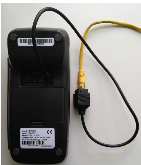
Рис. 9. Подключение к сети Ethernet

Для подключения терминала к сети Ethernet воспользуйтесь кабель-переходником, входящим в комплект поставки. Вставьте кабель в порт LAN/PSTN терминала, как показано на рис. 9, и подключите в ваше сетевое устройство.