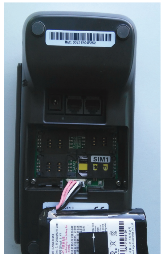
Рис. 13. Вставка SIM-карты

Поместите SIM-карту в слот, помеченный как «SIM1». Для этого откройте держатель карты, сдвинув его вправо, поместите SIM-карту и закройте слот, как показано на рис. 13.