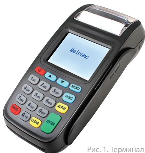
Рис. 1. Терминал New 8210

Внешний вид терминала представлен на Рис. 1.