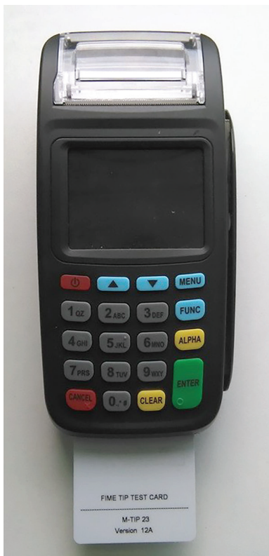
Рис. 5. Установка смарт-карты

Для того чтобы считать информацию со смарт-карты, вставьте ее в специально предназначенный для смарт-карт ридер, расположенный в нижней фронтальной поверхности терминала. Карта вставляется контактной площадкой вперед. Контактная площадка чипа карты должна находиться на верхней поверхности карты. Вставьте карту до упора. (Рис. 5)