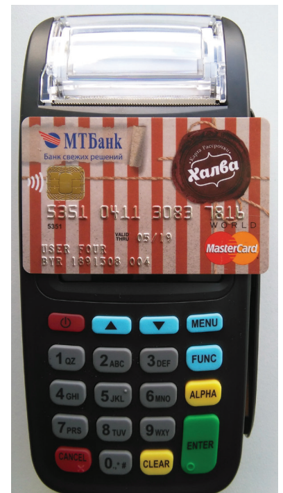
Рис. 6. Чтение бесконтактной смарт-карты

Для того чтобы считать информацию с бесконтактной смарт-карты, просто поднесите ее в область экрана терминала и задержите ее там до звукового сигнала (Рис. 6).