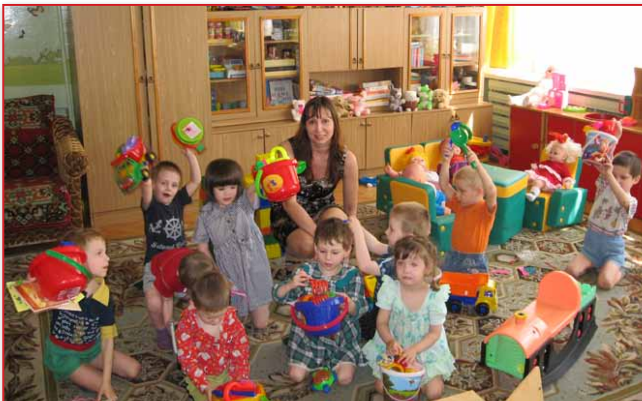
Детский дом №6, Минск